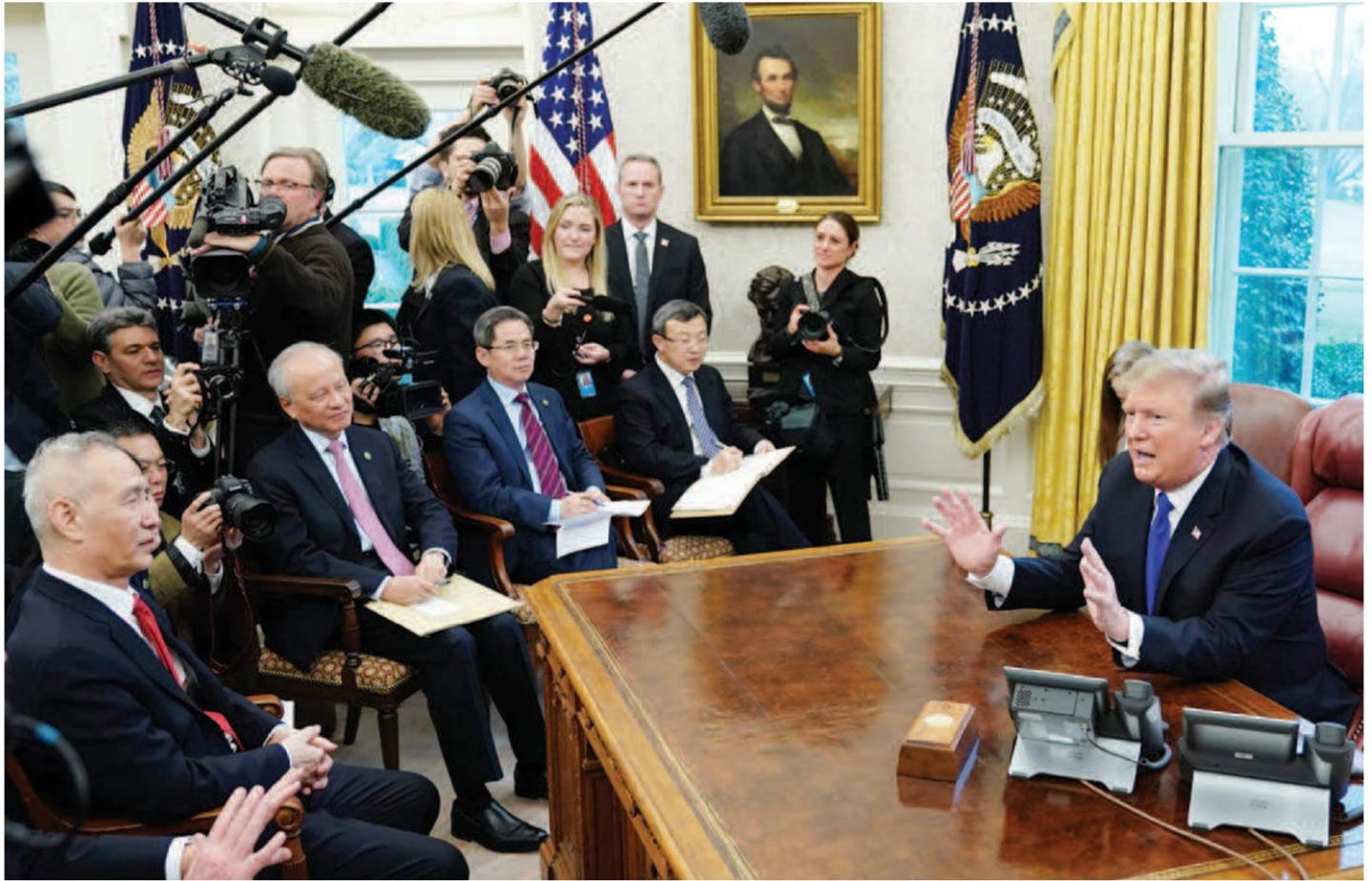
หารือ : โดนัลด์ ทรัมป์ ประธานาธิบดีสหรัฐฯ ขณะหารือกับนายหลิว เทอ รองนายกรัฐมนตรีจีนและคณะผู้แทนการค้าจีนที่ทำเนียบขาว เมื่อวันที่ 22 ก.พ. ที่ผ่านมา